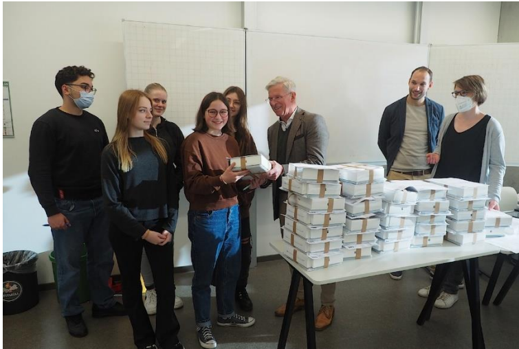
Die iPads werden an die SuS der Oberstufe überreicht