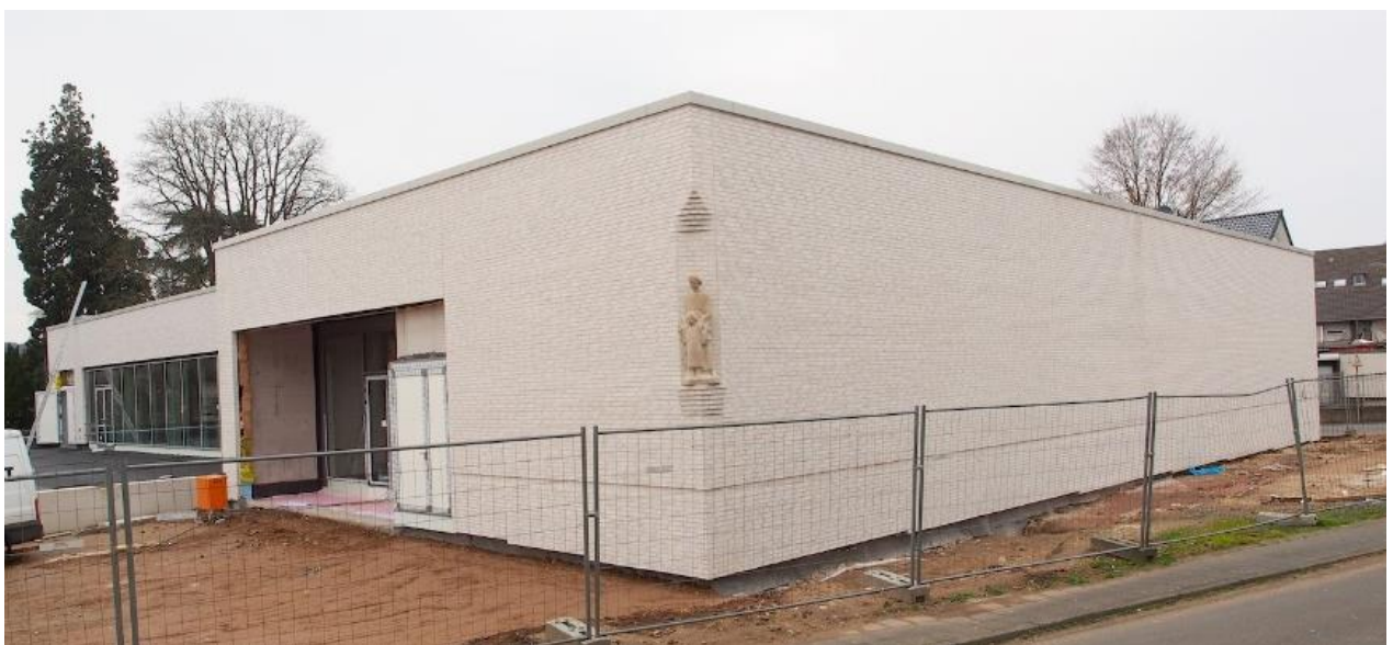
Ost- und Südansicht der neuen Sporthalle