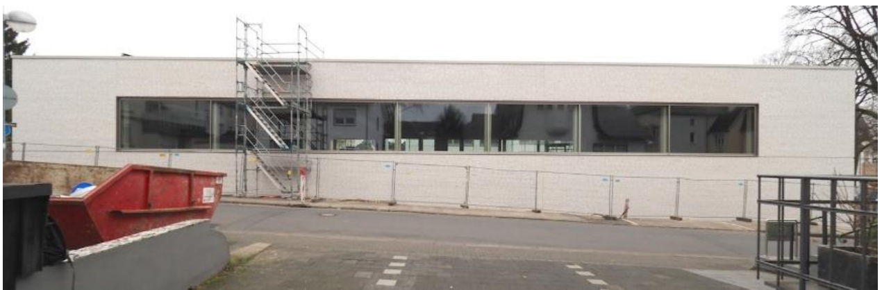
Nordansicht der neuen Sporthalle mit großer Fensterfront

Wir suchen für das 2. Halbjahr - und perspektivisch auch für weitere Schuljahre - Personen, die ein AG-Angebot für die Klassen 5-8 und/oder ein Übermittagsangebot durchführen können. Interessenten wenden sich bitte per Mail an unseren Ganztagskoordinator, Herrn Buchholz ( ganztag@sankt-josef-honnef.de ).